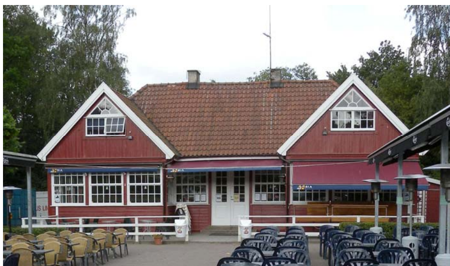
Stadsparkscaféet sommaren 2009. Stadsparkscaféet uppfördes 1922 efter en motion redan 1910 om att staden borde ha ett café i parken.

Utformningen av denna nya del av caféet utgår från de ovan beskrivna planerna med en ny axel. Stadsparkscaféet hamnar mycket strategiskt i stråket och är en viktig entrépunkt från sydväst. Anpassning ska ske såväl till verksamhetens krav, stadsparkscaféets utformning och parkens föreslagna utformning.