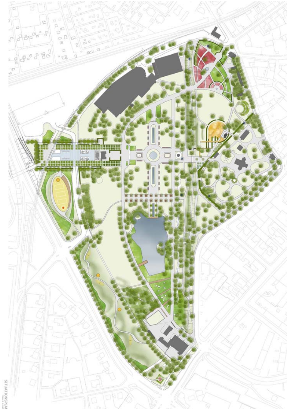
Utvecklingsplan för stadsparken, dat 2009-10-28, antagen av tekniska nämnden 2009-12-09