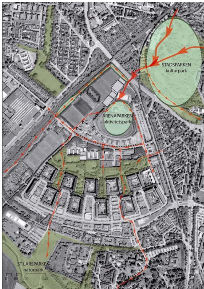
Ett pärlband av parkrum

Planen reglerar inte utformningen av parken utan gestaltning och genomförande av anläggningar på allmän platsmark såsom park och gata ansvarar tekniska förvaltningen för.