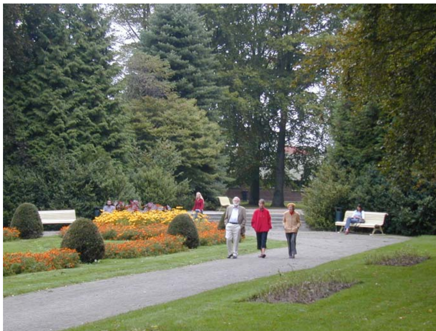
Parkens centrala delar

En förädling av parkens äldsta delar föreslås för att stärka bilden av en stadspark som speglar sin tid. De äldre delarna i samspel med dagens krav och önsknings om tillgänglighet och upplevelser.