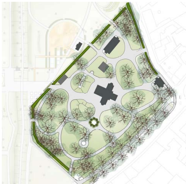
Observatorieparken med sina slingrande gångar och nya entré från Svanegatan

En ny öppning i Högevall kopplar den nya axeln samman med dels den gamla tvärxeln och dels med Observatorieparken och den nya entrén mot Svanegatan. Den nya axeln byggs i sin västra del ut till en paradaxel med dubbla rader av lindar liknande de befintliga vid Stadsparkskaféet.